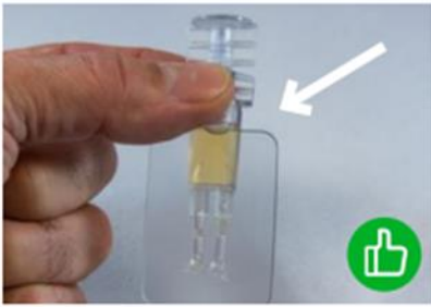
Abbildung 1: Wie öffne ich die Ophtiole?