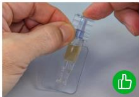
Abbildung 2: Wie verschliesse ich die Ophtiole ?

Zum Schliessen Verschlusskappe aufsetzen und anschliessend einschieben.