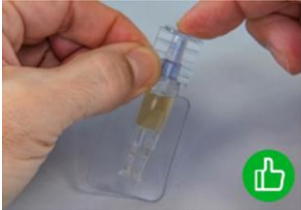
Illustration 2: Comment refermer l'ophtiole?

Fermeture: l'ophtiole doit être bien refermé immédiatement après utilisation. Fermez l'ophtiole en plaçant et en enfonçant le bouchon (voir illustration 2) et conservez-le au réfrigérateur entre 2 et 8 °C jusqu'à la prochaine utilisation, sans dépasser 24 heures.