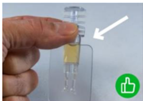
Figura 1: Come si apre l'oftiole?