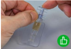
Figura 2: Come si richiude l'oftiole?

Chiusura: l'oftiole deve essere richiusa bene subito dopo l'uso. Chiudere l'oftiole inserendo il tappo (vedi figura 2) e conservarla in frigorifero a 2-8 °C fino al prossimo utilizzo, per non più di 24 ore.